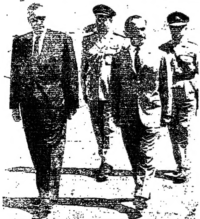
جلالة الحسين والرئيس عبد الناصر يستعرضان حرس الشرف في مطار القاهرة